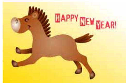
2014 is the Year of the Horse

リフォームした方、家が幾ら位かお知りになりたい方、市場価値推定を無料で致します。お売りになる計画が無くても遠慮は要りません。